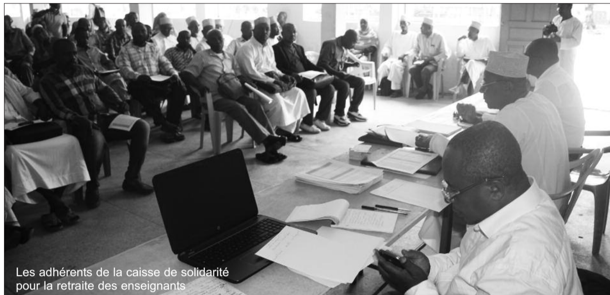
Les adhérents de la caisse de solidarité pour la retraite des enseignants

La particularité de cette caisse de solidarité pour les enseignants est que chaque enseignant peut obtenir l'aide des autres membres.