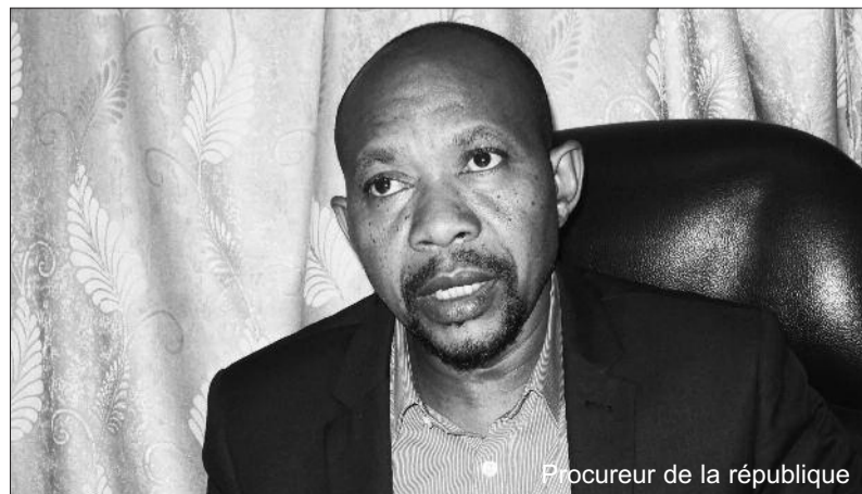
Procureur de la république